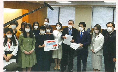
令和3年3月29日 「HPV ワクチンの積極的勧奨再開を目指す 議員連盟」事務局長として、田村憲久厚労 大臣への要望申し入れ