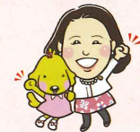
令和3年 3月21日 第88回 自由民主党大会。 手話で党歌斉唱を 行いました。