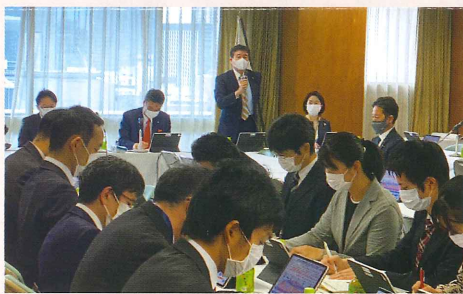
令和3年4月6日「新型コロナウイルス感染症対策本部 情報戦略・システムPT・訪日外国人観光客コロナ対策PT合同会議」にて