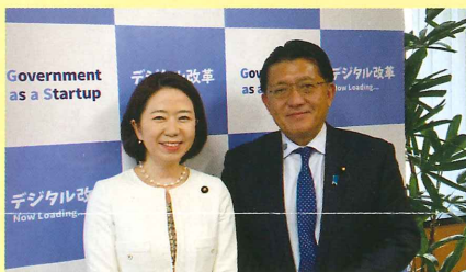
平井卓也デジタル改革担当大臣とラジオ収録