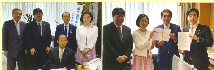
令和3年3月31日 二階俊博自民党幹事長、下村博文政調 会長に提言申入れ。

平素より温かいご理解とご支援を賜り、誠に有り難うございます。 新型コロナウイルス感染症を巡っては、いまだに厳しい情勢が続 いております。