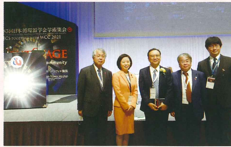
令和3年3月27日 第85回日本循環器学会学術集会にて 講演