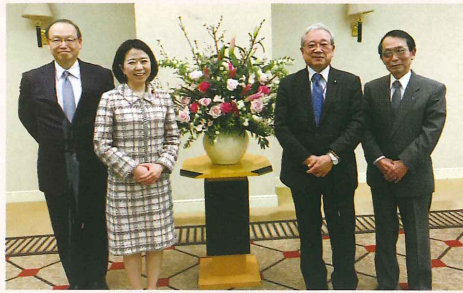
令和3年3月13日 高知県医師会での国政報告会