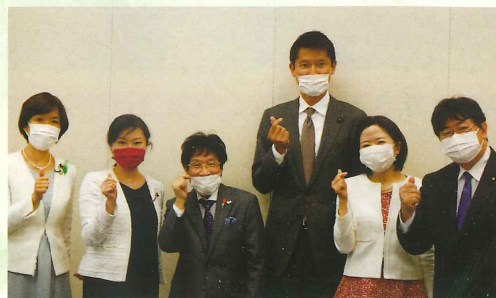
令和3年4月15日 教育評論家の 尾木直樹先生を迎え第10回勉強会を開催。

自民党「こども・若者」未来本部」と並行して、これからも勉強会ではChildren First の視点から様々な課題を掘り下げて議論して参ります。